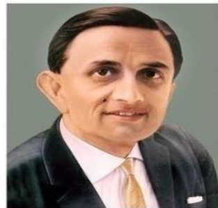
Dr. Vikram Sarabhai

La inspiración debe ser tomada de los hombres indios no de burros